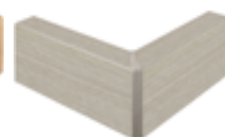
nobilitato rovere sabbia