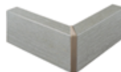
nobilitato rovere grigio