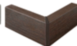
nobilitato rovere terra